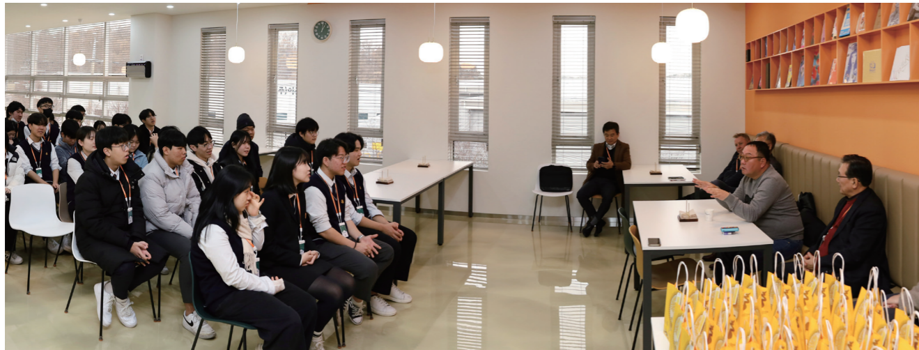
격의 없는 대화로 진솔한 내용이 오고간 간담회 전경