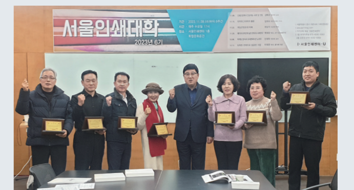
인쇄대학 제6기 수료식